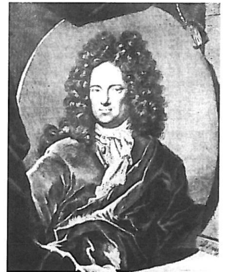
Ehrenfried Walther von Tschirnhaus (1651-1717)

Tschirnhaus, die C. Oldenburgh (diplomaat annex filosoof, 1618-1677) en G.W. Leibniz (1646-1716) had bezocht en wist van Leibniz' interesse in Spi-noza's Ethica in verband met diens eigen monadenleer, is in de zomer van 1677 te Rome. Daar ontmoet hij Nils Stensen (Steno (Lat.), 1638-1686), anatoom en lutheraan, die Spinoza kende uit de tijd dat hij te Leiden studeerde bij Francis-cus de le Boë Sylvius. Steno beschouwde Spinoza's Ethica als een gif, een besmettingsbron, waarvan de publicatie verhinderd diende te worden. Via Tschirnhaus kreeg Steno, die zich bekeerde tot het katho-licisme, een exemplaar van de Ethica in bezit, waarmee hij als exponent van de Contra-reformatie naar het Officie, lees: de Inquisitio, stapte, welke een procedure startte, die leidde tot plaatsing op de Index in 1680. De Opera Posthuma waren intussen al gedrukt. De Vaticaanse