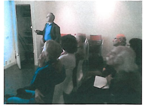
Tijdens de presentatie