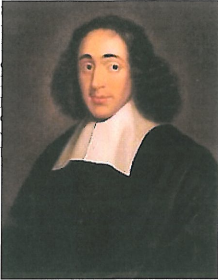
Het Haagse portret van Baruch Spinoza, ca. 1665

een recent gevonden manuscript van Benedictus de Spinoza (24 november 1632--21 februari 1677).